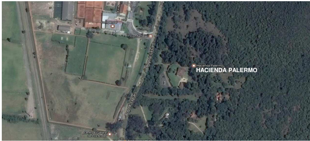
FOTOGRAFIA DE CONTEXTO